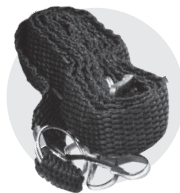
Ремінець на плече