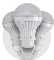
Три виносні LED-лампи

• бокова панель - до 12 г • лампочки – до 7 г