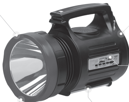
Основний прожектор потужністю 5 Вт

Дальність освітлення до 300 метрів в основному режимі